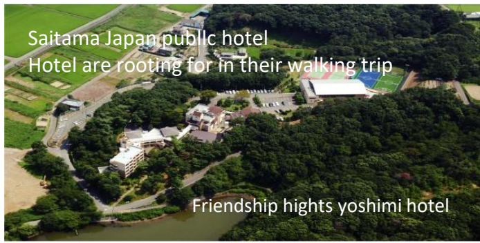
Saitama Japan public hotel Hotel are rooting for in their walking trip